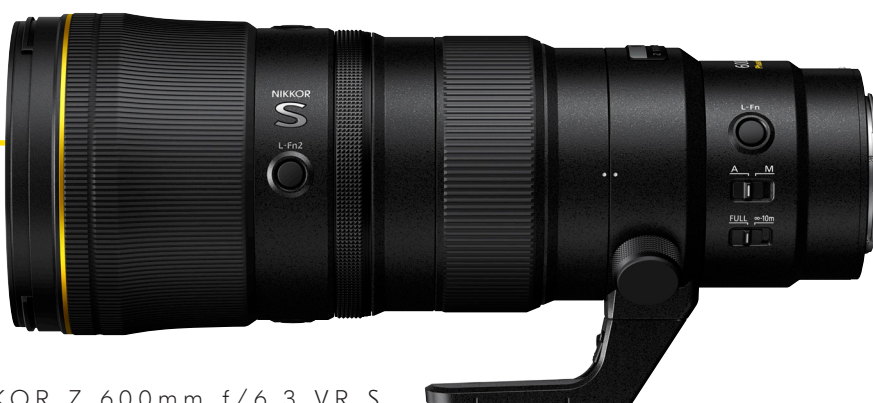
NIKKOR Z 600mm f/6.3 VR S